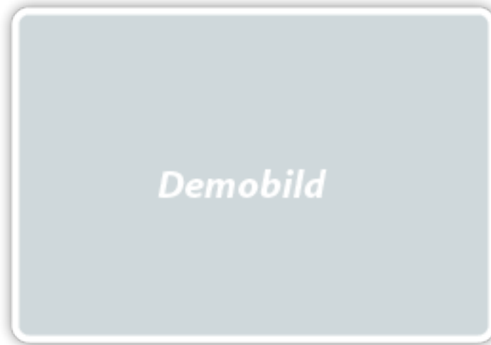
Abbildung 1: Einzelne Bilder wie dieses sollten zentriert auf der Seite platziert werden. Auf eine sinnvolle Größe ist ebenso zu achten, wie auf eine konkrete Beschreibung der Abbildung.

Sed consequat tellus et tortor. Ut tempor laoreet quam. Nullam id wisi a libero tristique semper. Nullam nisl massa, rutrum ut, egestas semper, mollis id, leo. Nulla ac massa eu risus blandit mattis. Mauris ut nunc. In hac habitasse platea dictumst. Aliquam eget tortor. Quisque dapibus pede in erat. Nunc enim. In dui nulla, commodo at, consetetuer nec, malesuada nec, elit. Aliquam ornare tellus eu urna. Sed nec metus. Cum sociis natoque penatibus et magnis dis parturient montes, nascetur ridiculus mus. Pellentesque habitant morbi tristique senectus et netus et malesuada fames ac turpis egestas.