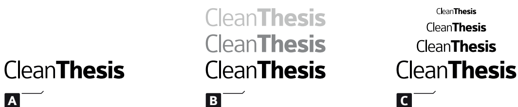
Fig. 3.1: Figure example: (a) example part one, (c) example part two; (c) example part three

Lorem ipsum dolor sit amet, consectetur adipiscing elit. Ut purus elit, vestibulum ut, placerat ac, adipiscing vitae, felis. Curabitur dictum gravida mauris. Nam arcu libero, nonummy eget, consectetur id, vulputate a, magna. Donec vehicula augue eu neque. Pellentesque habitant morbi tristique senectus et netus et malesuada fames ac turpis egestas. Mauris ut leo. Cras viverra metus rhoncus sem. Nulla et lectus vestibulum urna fringilla ultrices. Phasellus eu tellus sit amet tortor gravida placerat. Integer sapien est, iaculis in, pretium quis, viverra ac, nunc. Praesent eget sem vel leo ultrices bibendum. Aenean faucibus. Morbi dolor nulla, malesuada eu, pulvinar at, mollis ac, nulla. Curabitur auctor semper nulla. Donec varius orci eget risus. Duis nibh mi, congue eu, accumsan eleifend, sagittis quis, diam. Duis eget orci sit amet orci dignissim rutrum.