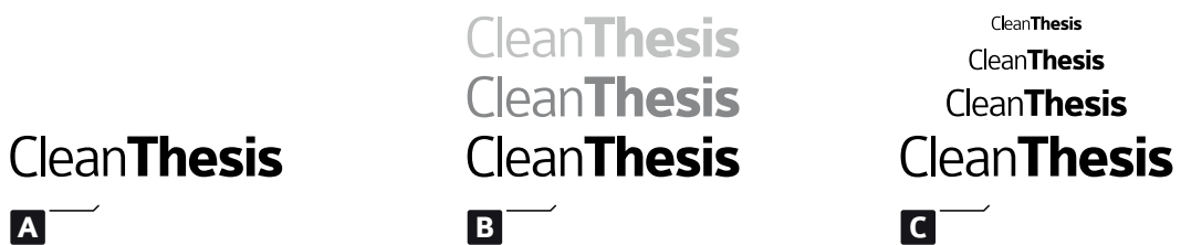
Fig. 3.2: Another Figure example: (a) example part one, (c) example part two; (c) example part three

Morbi luctus, wisi viverra faucibus pretium, nibh est placerat odio, nec commodo wisi enim eget quam. Quisque libero justo, consectetur a, feugiat vitae, porttitor eu, libero. Suspendisse sed mauris vitae elit sollicitudin malesuada. Maecenas ultricies eros sit amet ante. Ut venenatis velit. Maecenas sed mi eget dui varius euismod. Phasellus aliquet volutpat odio. Vestibulum ante ipsum primis in faucibus orci luctus et ultrices posuere cubilia Curae; Pellentesque sit amet pede ac sem eleifend consectetur. Nullam elementum, urna vel imperdiet sodales, elit ipsum pharetra ligula, ac pretium ante justo a nulla. Curabitur tristique arcu eu metus. Vestibulum lectus. Proin mauris. Proin eu nunc eu urna hendrerit faucibus. Aliquam auctor, pede consequat laoreet varius, eros tellus scelerisque quam, pellentesque hendrerit ipsum dolor sed augue. Nulla nec lacus.