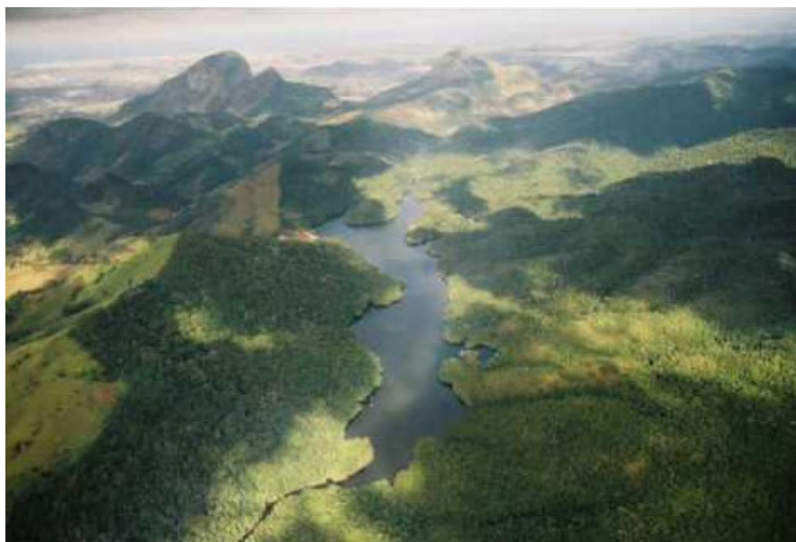
Figura 2 – Imagem aérea da área da represa do Rio Duas Bocas.

Esta região está sujeita a uma imensa gama de fatores ambientais e antrópicos, que atuando em velocidades diferentes, resultam em uma grande diversidade de impactos. Dessa forma, para análise da interação desses processos será propostos o uso de ferramentas que se contextualizam com essas dinâmicas trazendo em seu corpo a capacidade de leituras temporais rápidas.